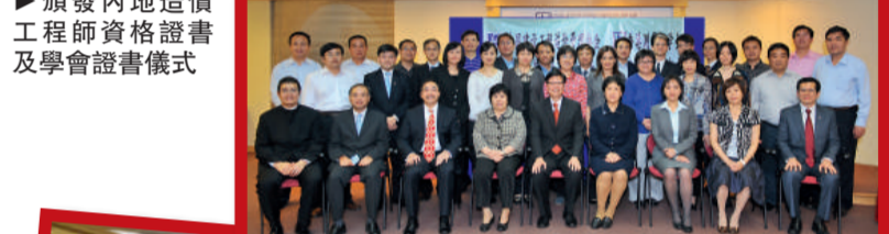
▶頒發內地造價工程師資格證書及學會證書儀式

香港在未來數年將進行或開展多項大型基建及物業發展項目，其中包括港珠澳大橋、高鐵路、新港鐵支線、各港線鐵路及上蓋及附屬物業發展、西九龍文娛藝術區、東啟德郵輪碼頭、東九龍轉型為商業區、香港國際機場第三跑道，再加上內地房地產的高速發展，未來十年香港對專業工料測量師人才的需求將大增，故此今年工料測量組也積極推廣工料測量專業，包括到中學及各大學與師生分享專業測量人才的未來發展，使有志成為專業工料測量師的同學及他們的家長對這專業有更全面的認識。 為鼓勵就讀各大學測系的同學投身工料測量專業，工料測量組連同工料測量顧問公司(也有個人會員名義)設立獎學金。頒獎禮已於本年9月8日舉行，共有36名學生得獎。 國際事務方面，工料測量組每年都會派代表參加太平洋區工料測量師協會(PAQS)年會及國際會議。今年的會議在斯里蘭卡舉行，共有十四個地方代表出席。香港測量師學會將於2014年在香港舉辦這國際盛事，學會並已委任前會長梁建基測量師為籌委會主席。 繼2005年後，工料測量組與中國建設工程造價管理協會於本年10月在香港舉行造價工程師資格證書及香港測量師學會會員文憑頒發儀式。這已是第二批香港工料測量師(共166人；第一批有173人)取得內地造價工程師資格，從而增強香港測量師在內地發展的潛力。第二批內地造價工程師(共172人；第一批人數為197人)也成為了香港測量師學會會員。