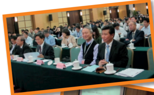
▶香港測量師學會產業測量組代表團，參加中國房地產估價師與房地產經紀人學會(CIREA)年會及估價論壇