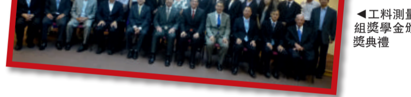
▶工料測量組獎學金頒獎典禮