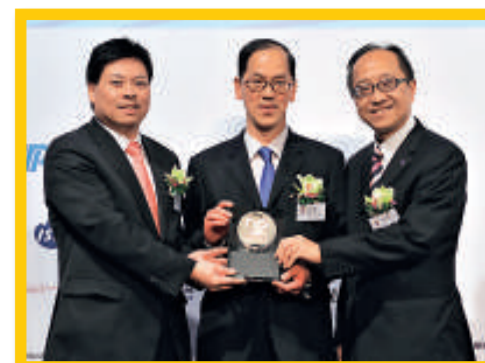
▲民政事務專員局長曾德成、GBS, JP(中)出席優異物業設施管理大獎頒獎典禮

香港測量師學會是代表香港測量專業的組織。我們透過嚴謹的專業評核試，甄選會員；亦透過專業實務守則、操守規章及持續專業進修，以維持測量師學會會員的專業及操守方面的水平。本會一直扮演著重要的諮詢角色，尤其是在政府制定牽涉土地、物業、房屋及建築政策時，本會就政府的諮詢提供回應及意見。 在過去一年，測量師的專業意見在政府制定政策及草擬法例的過程中受到認同。由舊建、劏房、一手住宅物業銷售，以至房屋政策，本會一直表達專業及不偏不倚的意見，期望進一步完善香港社會。 我們亦持續與世界各地的相關專業組織合作。除了在廣州、北京及上海成立議會外，本會亦計劃在中國成立更多聯絡點，與身處中國內地的會員加強聯繫。這不僅提升本會的國際形象，而且更為在外地工作的會員提供便利。在回顧今年所成就的佳績之際，我們未有忘記一群能幹、專注及忠誠的執理事務、理事會成員、會員及辦事處的職員。過往一年，在他們的努力下，本會才能實現願景和計劃。 最後，我衷心感謝社會各界對學會所作出的貢獻及支持，希望各位與我一同祝願學會會務蒸蒸日上，發展事事順利。