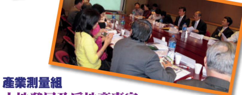
▶香港測量師學會產業測量組安排世界估價組織(WAVO)在香港舉行國際會議