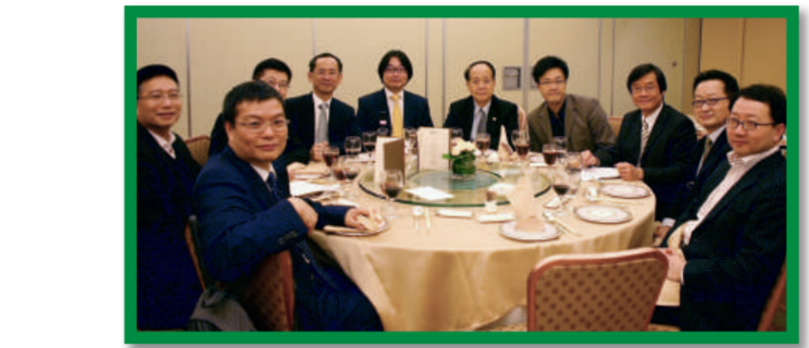
▲規劃及發展組理事會

規劃及發展測量師的專業服務工作範圍包括物業發展、項目可行性研究、土地管理、城市規劃申請、發展項目管理、專業評估，以及參與城市規劃、土地、房屋、環境等發展策略及政策研究。 規劃及發展組認同持續進修對各專業會員的重要，年內分別舉辦多項專業持續進修活動，涉及不同專題，包括廣州市訪問團、香港國際機場2030規劃、首次主辦規劃及發展會議，亦派員參與2011年內地與香港建築業論壇，以及參與在摩洛哥舉行的國際測量師聯會周年大會等。