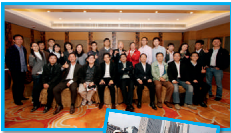
▲土地測量組委員合照