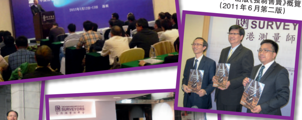
▼學會積極參與社區工作，出版《強制售賣》(2011年6月第二版)